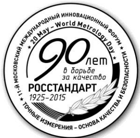
Золотая медаль Форума