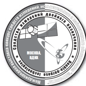
Платиновая медаль «Средств измерений двойного назначения»