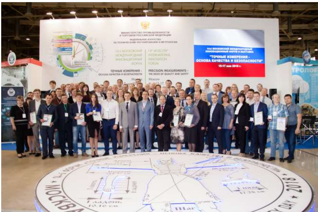
Фото 9. Групповое фото победителей конкурсной программы