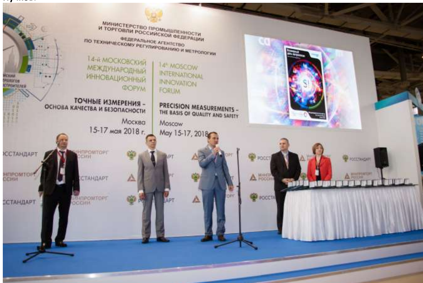
Фото 7. Торжественная церемония награждения участников форума и выставки

Конкурсная комиссия на основании заключений экспертного центра ФБУ «Ростест-Москва» постановила о присуждении Знака Качества по одной из пяти номинаций 24 средствам измерений, Золотой медали выставки – 58 номинаций, Платиновой медалью выставки – 5 номинаций. Памятные дипломы были вручены 82 региональным ЦСМ и 7 национальным метрологическим институтам , принявшим участие в выставочной программе форума.