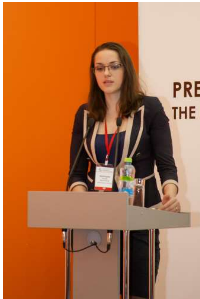
Фото 4. Торжественная церемония открытия форума и выставки 2018 года

Из выступления Директора Департамента государственной политики в области технического регулирования, стандартизации и обеспечения единства измерений Минпромторга России Оксаны Мезенцевой : «Разрешите всех вас поздравить с наступающим Всемирным Днем метрологии. Я рада, что мы можем в рамках данного форума обсудить те вызовы, которые бросает нам глобальная экономика, в том числе переход на цифровые модели и системы. Перед началом открытия форума, мы вместе с Алексеем Владимировичем прошлись по выставочной экспозиции и приятно радуется, что количество отечественных производителей растет. В этом заслуга каждого из нас, кто работает в данном направлении. В свою очередь отмечу, что цифровая экономика – это не просто абстрактная тема, это реальный комплекс вопросов по сертификации, подтверждения соответствия, контроля и метрологии. Форум становится той площадкой, которая своевременно позволяет вырабатывать решения для продвижения измерительной продукции и обеспечения единства измерений. Россия традиционно обладает уникальными промышленными