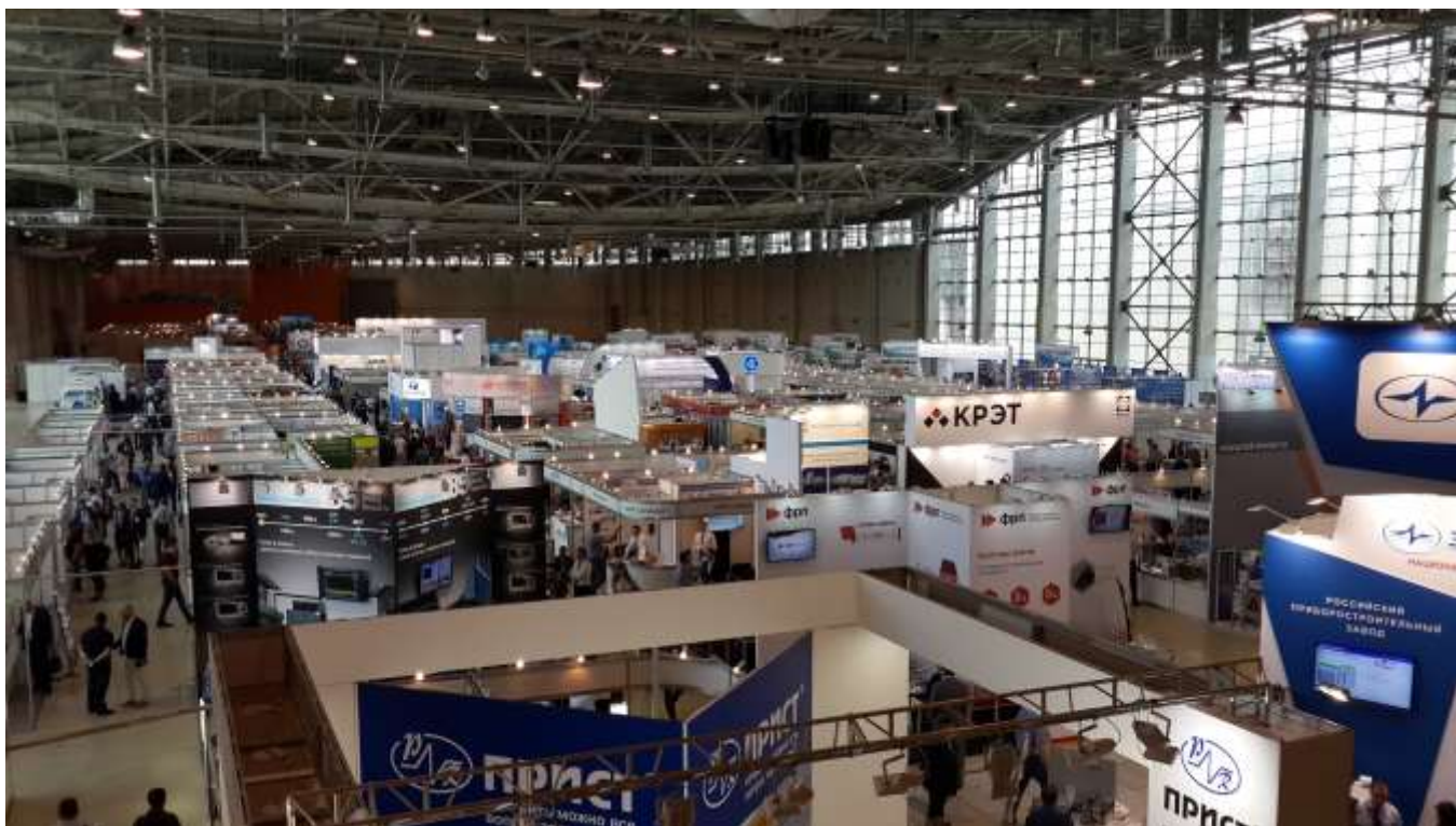
Фото 1. Выставочная экспозиция форума 2018 года

Основная цель конкурса – аттестация приборов и оборудования, относящихся к различным средствам измерений, диагностики, испытаний и аналитики, на соответствие их высоким метрологическим характеристикам и качеству, а также награждение наиболее актуальных выставочных экспозиций и активных участников съезда метрологов и приборостроителей.