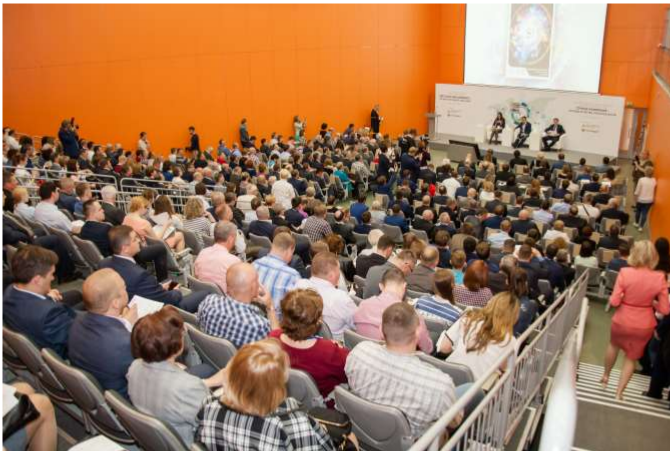
Фото 5. Торжественная церемония открытия форума и выставки 2018 года

компетенциями, которые на наш взгляд, позволят создать те уникальные разработки, продукты и технологии. И безусловно роль метрологии в этой связи становится ключевой».