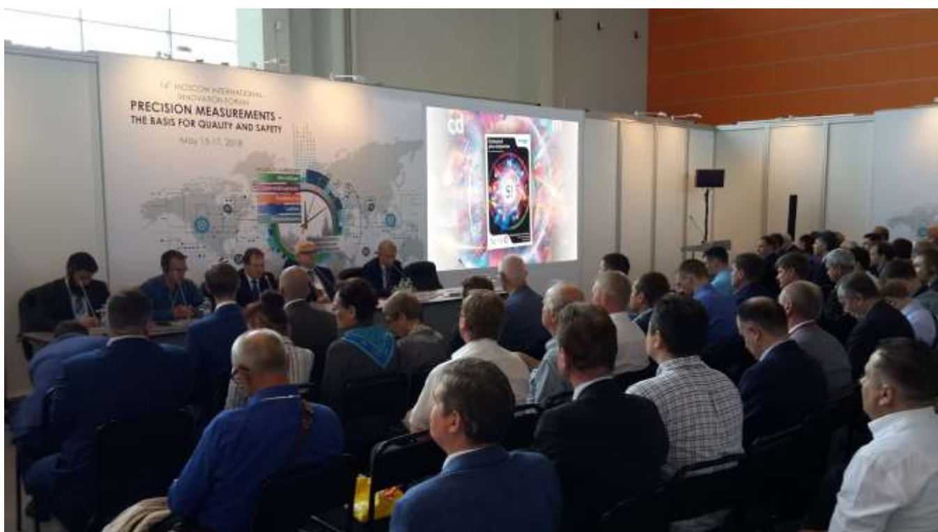
Фото 6. Международная конференция – Метрология цифровой экономики