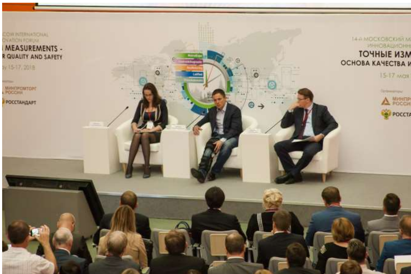
Фото 3. Торжественная церемония открытия форума и выставки 2018 года