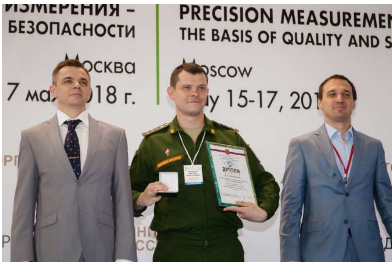
Фото 8. Награждение победителей конкурсной программы